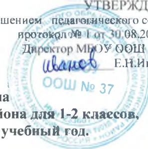
Таблица-сетка часов учебного плана МБОУ ООШ № 37 х. Крикуна Красноармейского района для 1-2 классов, реализующих ФГОС НОО-2021 на 2023 – 2024 учебный год.

Приложение 1 УТВЕРЖДЕНО решением педагогического совета протокол № 1 от 30.08.2023 г. Директор МБОУ ООШ № 37 Е.Н.Иванов