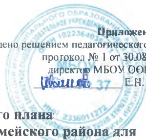
Таблица-сетка часов учебного плана МБОУ ООШ № 37 х. Крикуна Красноармейского района для 7 -9 класса, реализующих ФГОС ООО на 2023 – 2024 учебный год

Приложение № 4 утверждено решением педагогического совета протокол № 1 от 30.08.2023 г. директор МБОУ ООШ № 37 Е.Н. Иванов